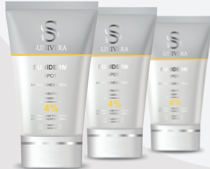
SUNIDERM ANTI-SPOT CREAM

How to use: Apply a thin layer to clean hyperpigmentation spot before bed. Use a suitable sunscreen with high SPF, such sunivera before exposure to sunlight.