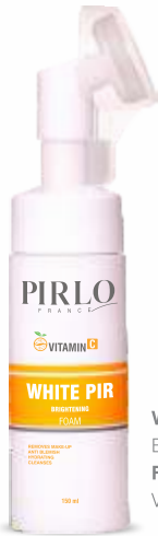
WHITE PIR BRIGHTENING FOAM VITAMIN C

مقداری از کف را بر روی پوست مرطوب ماساژ دهید و سپس آبکشی نمایید.