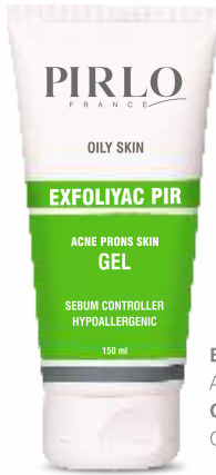
EXFOLIYAC PIR ACNE PRONS SKIN GEL OILY SKIN

مقداری از ژل را با دست ماساژ دهید تا کف ایجاد شود، سپس بر روی پوست مرطوب ماساژ دهید و در نهایت آبکشی نمایید.