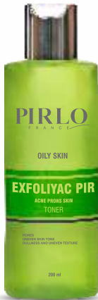
EXFOLIYAC PIR ACNE PRONS SKIN TONER OILY SKIN

سپس به صورت ضربه ای بر روی پوست استفاده نمایید این محصول نیاز به آبکشی ندارد