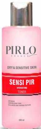
SENSI PIR HYDRATING TONER DRY & SENSITIVE SKIN