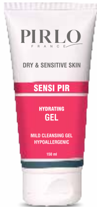
EXFOLIYAC PIR ACNE PRONS SKIN GEL OILY SKIN

سپس بر روی پوست مرطوب ماساژ دهید و در نهایت آبکشی نمایید.