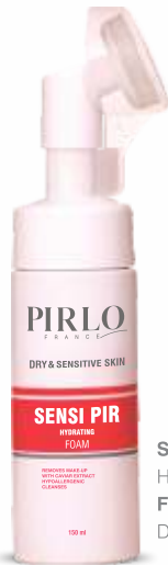
SENSI PIR HYDRATING FOAM DRY & SENSITIVE SKIN

مقداری از کف را بر روی پوست مرطوب ماساژ دهید و سپس آبکشی نمایید.